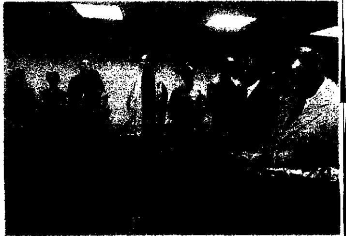
Une minute de silence a suivi la prise de parole du préfet.

tion de l'employeur sur le salarié», les agents en présence ont fait le constat, amer, que leur mission, qu'ils jugent «d'intérêt général», est injustement considérée : «Les employeurs perçoivent les règles comme des agressions». Le doigt est mis sur le déficit d'autorité de l'Inspection du travail auprès des employeurs, et sur le manque de légitimité de la législation du travail, perçue parfois comme une entrave à la liberté d'entreprendre. Résultat : les menaces se multiplient. «En Angleterre, le logo du ministère du travail suffit à faire taire les employeurs les plus énervés», lâche M. Weber, témoignant ainsi du sentiment d'impuissance des inspecteurs français, pas toujours