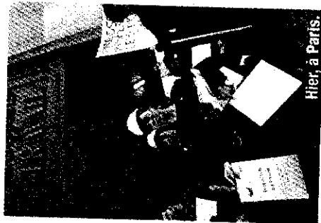
Hier, à Paris, risques encourus par les agents, ainsi que la création d'une mission sur leur pratique professionnelle ne sont pas à la hauteur de leurs attentes. Les inspecteurs reconnaissent néanmoins quelques avancées dans le soutien juridique aux agents mais il faut, selon eux, « aller plus loin ».

Cette grève fait suite à l'assassinat de deux inspecteurs en service le 2 septembre en Dordogne. Les manifestants ont également défilé pour condamner les « organisations professionnelles patronales qui incitent au non-respect de la loi » et réclamer « un renforcement très important » de leurs moyens. L'intersyndicale qui a lancé la grève, s'est déclarée déçue de ses rendez-vous hier avec les ministres de l'Agriculture et des Relations du travail. Elle estime que les propositions de ce dernier pour évaluer les