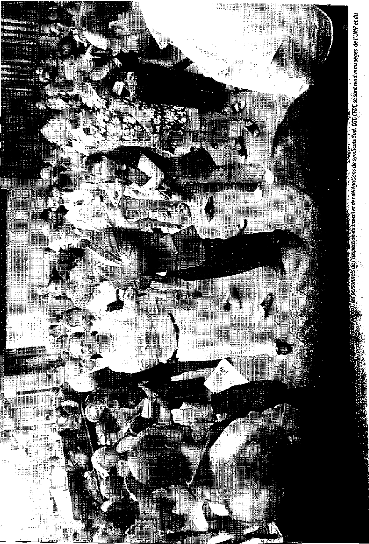
(contre photo), les personnels de l'inspection du travail et des délégations de syndicats Sud, CCI, CFDT, se sont rendus au siège de l'UMP et du